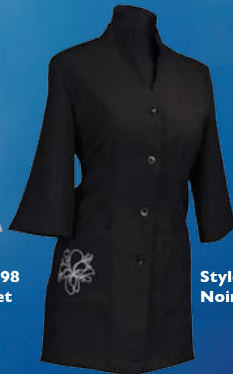
Style 299 Noir