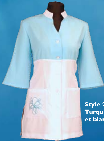
Style 297 Turquoise et blanc