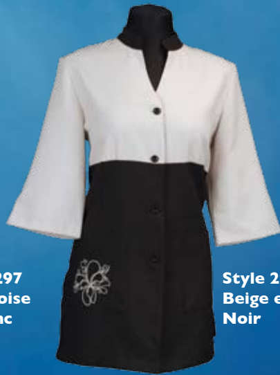
Style 298 Beige et Noir